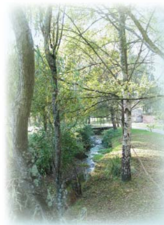
Le Moulin de la Rivière

Commentaire : Le circuit peut être fait dans les deux sens